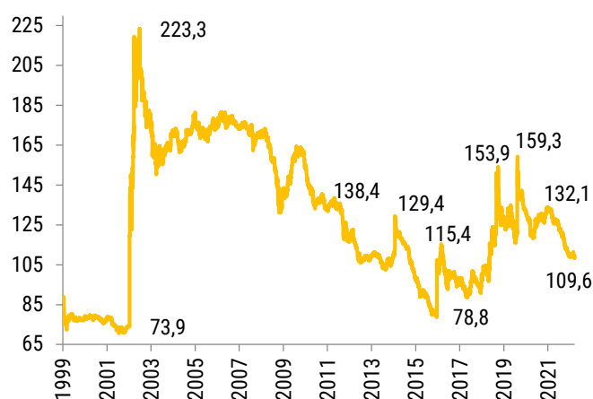
Tipo de cambio real – Cotizaciones históricas a precios actuales